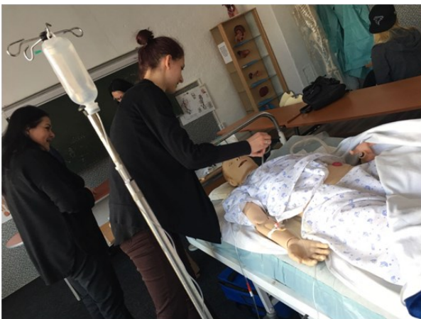
„Asistent Medical Generalist” prin O.M. nr. 3527/28.03.2016.